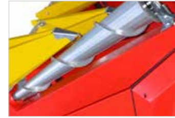
Przenośniki ślimakowe do transportu kukurydzy (opcja) Шнеки для уборки кукурузы (опция)