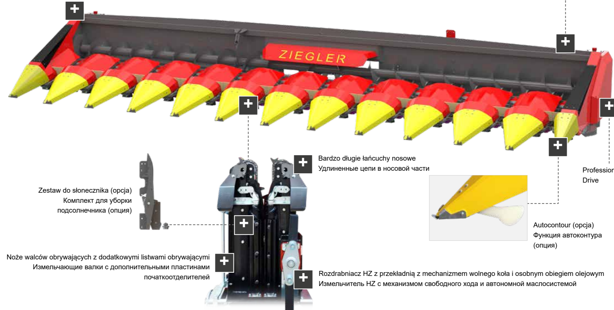
Zestaw do słonecznika (opcja) Комплект для уборки подсолнечника (опция)