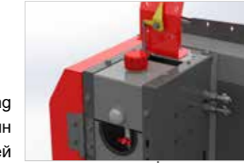
Stufenlose Pflückplattenverstellung Бесступенчатая регулировка пластин початкоотделителей